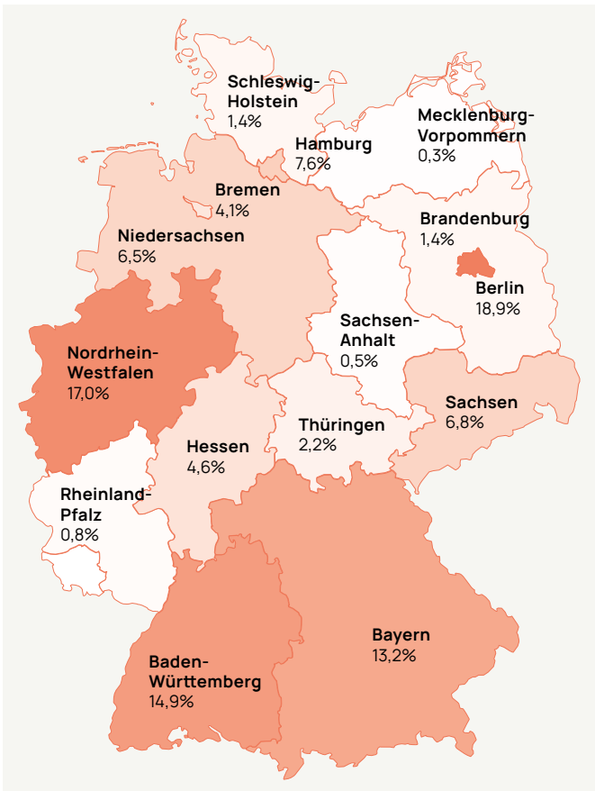
Abb. 6: In welchem Bundesland hat Ihr Ensemble den Geschäftssitz? (n = 370).